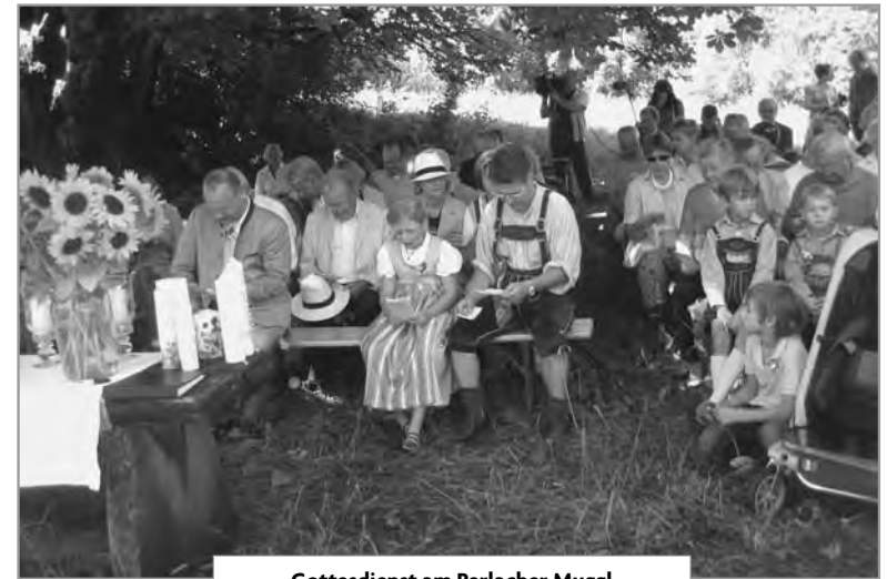
Gottesdienst am Perlacher Muggl