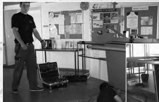
Endlich barrierefrei! Die Emmauskirche hat mit Unterstützung der Episcopal Church of the Ascension einen Treppentift eingebaut, so dass Gemeindeglieder in Rollstühlen von der Kirche in den Gemeindesaal fahren können.