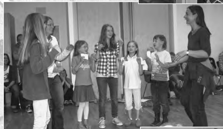
Auf der Familienfreizeit haben Kinder und Erwachsene je ihr eigenes Programm, spielen zusammen die „Abenteuer des Robinson Crusoe“ und feiern einen Gottesdienst, zu dem alle etwas beitragen