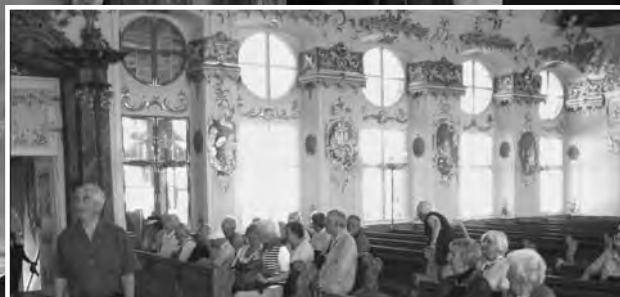
Gemeindeglieder aus Emmaus, Heilige Familie und Maria Immaculata besuchen auf dem ökumenischen Ausflug die Abtei Oberschönenfeld