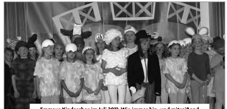
Emmaus Kinderchor im Juli 2011: Wie immer hin- und mitreißend

Samstag 15. Oktober, Sonntag 16. Oktober jeweils 17 Uhr