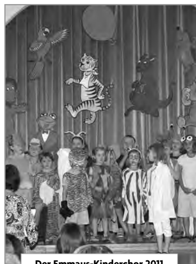
Der Emmaus-Kinderchor 2011